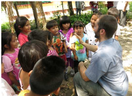
(Ebana Einschulpatenkinder 2016) (Dank des Direktors für ebana-Einsatz / den Spendern)

Ebana ist nun auch Pate für die Kinder welche kommenden Herbst eingeschult werden.