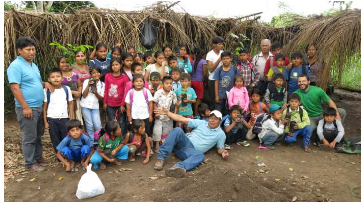
(Nach getaner Arbeit)

Ebana ist nun auch Pate für die Kinder welche kommenden Herbst eingeschult werden.