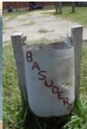
(Der erste Mülleimer in der Schule)