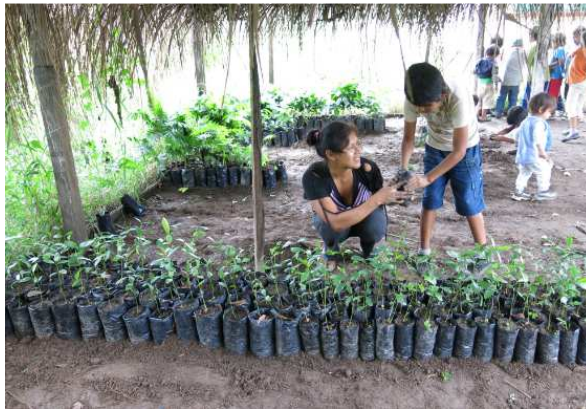
(Ordnen um Umsetzen der Bäumchen)