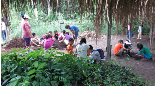
(Blick in die Baumschule. Eintüten, Erdmischung)