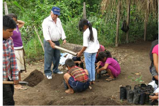
(Erde verfeinern bzw. Sieben)